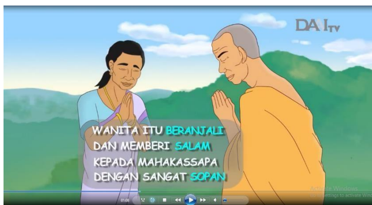
Gambar 4.15 Leksia dan scene pada menit ke 01:09

Kode kultural atau kode budaya merupakan kode yang berisikan tentang ilmu pengetahuan. Penonton dapat mengindikasikan tipe pengetahuan dari pengalaman yang pernah ditemui. Latar sosial budaya yang terdapat pada film memungkinkan adanya suatu kesinambungan dengan budaya sekarang atau budaya sebelumnya. Dalam film Semangka Mahakassapa, kode kultural ditemukan leksia " Wanita itu berañjali dan memberi salam kepada Mahakassapa dengan sangat sopan " dalam scene pada menit ke 01:09. Leksia dapat dilihat pada gambar berikut: